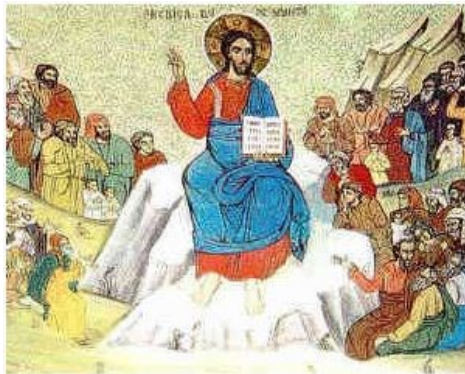
Icona "Discorso della montagna"

11 Beati voi quando vi insulteranno, vi perseguiteranno e mentendo, diranno ogni sorta di male contro di voi per causa mia. 12 Rallegratevi ed esultate, perché grande è la vostra ricompensa nei cieli. Così infatti hanno perseguitato i profeti prima di voi.