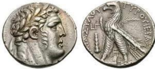
Siclo: l'aquila è l'emblema della città di Tiro