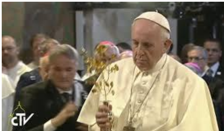
Papa Francesco offre la rosa alla Madonna

Ricordiamo anche, dal punto di vista storico, che, verso l'anno 1000 d.C., il papa si recava nella Basilica di Santa Croce in questa Domenica portando una ROSA D'ORO e spiegandone il significato al popolo.