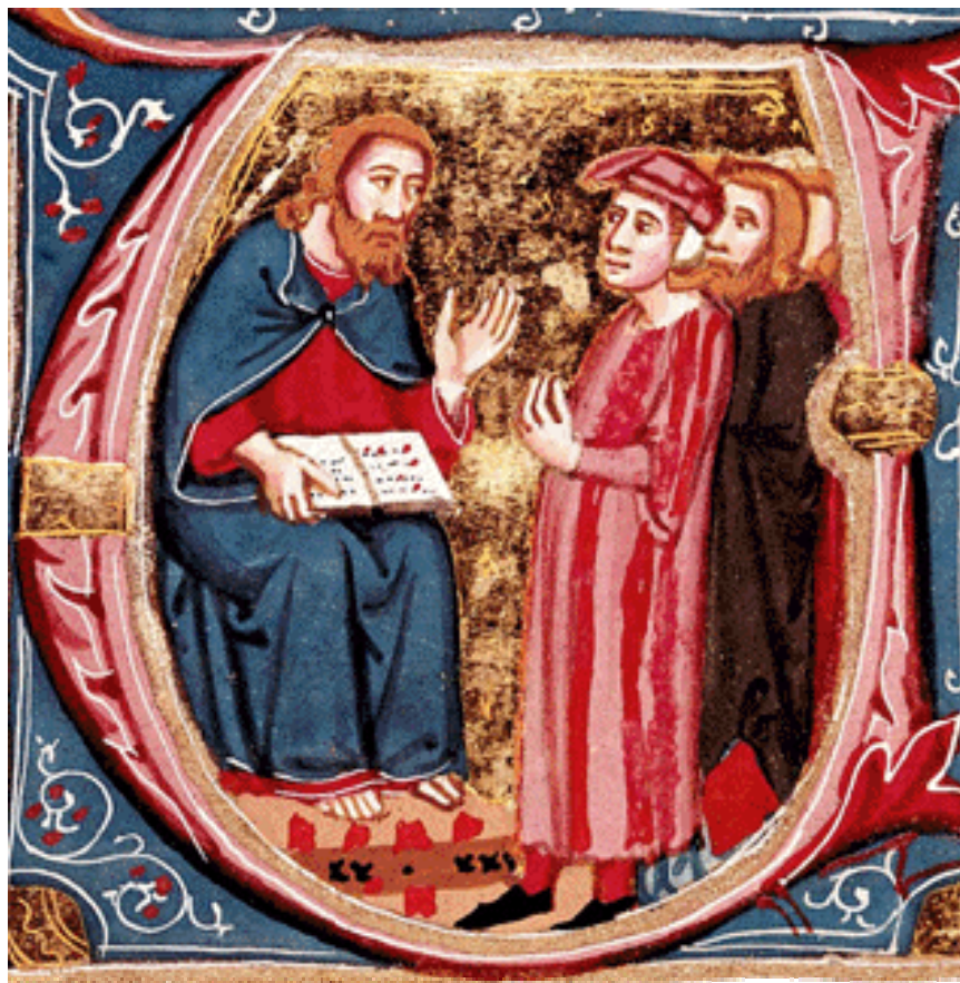
Esdra legge la Torah al popolo, miniatura del secolo XV, Venezia, Biblioteca Marciana