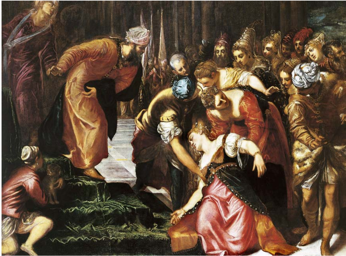
Il Tintoretto - Ester sviene al cospetto di Assuero - Pinacoteca Civica - Cuneo -