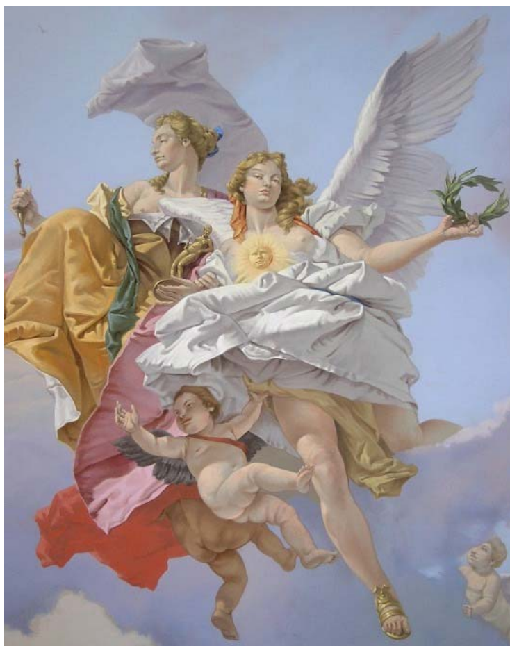
Gian Battista Tiepolo - il trionfo della forza e della sapienza