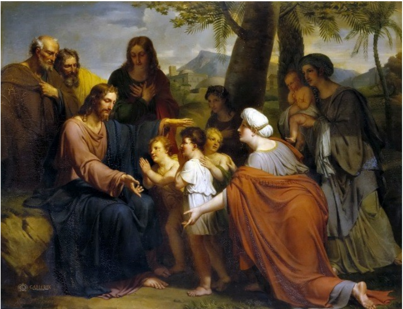
ANTOINE ANSIAUX Lasciate che i bambini vengano a me (1820) - Olio su tavola - Francia - Museo di Versailles

Lo sapevi che è facile entrare nel Regno di Dio?