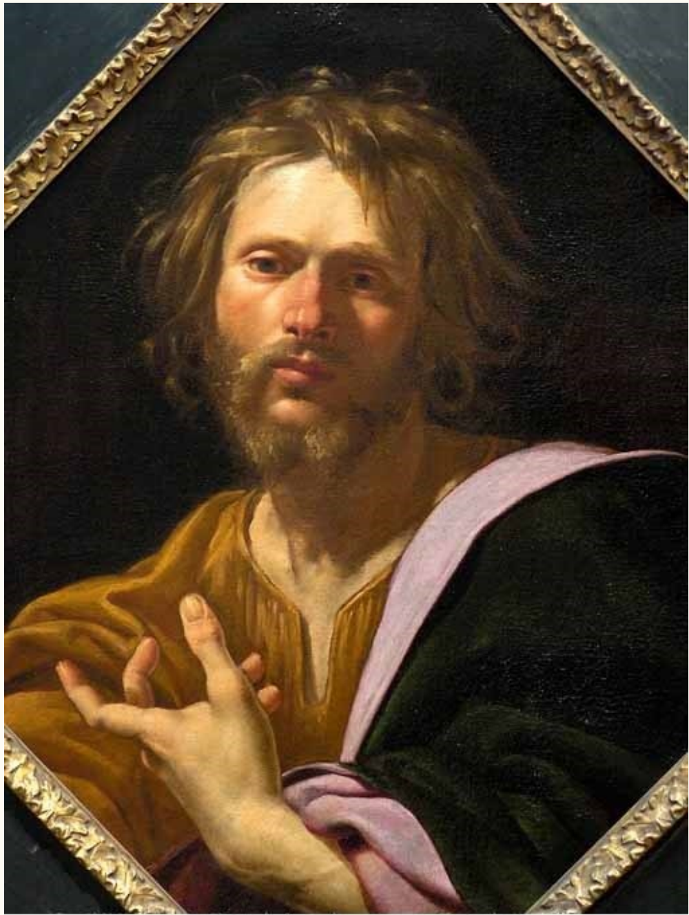
Simon Vouet, S. Luca evangelista, 1622-25