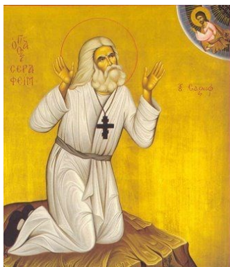
San Serafino di Sarov, monaco ortodosso del XIX secolo

Dice San Serafino di Sarov, monaco ortodosso, vissuto in Russia nel XIX secolo [è molto istruttivo leggere sul sito ortodosso “nati dallo spirito.com” il brano sullo Spirito Santo] in Istruzioni spirituali : «Dobbiamo dedicarci con tutte le nostre forze a salvaguardare la pace dell’anima e a non indignarci quando gli altri ci offendono. Non vi è nulla al di sopra della pace in Cristo , grazie alla quale vengono annientati gli assalti degli spiriti del male (del cielo e della terra)».